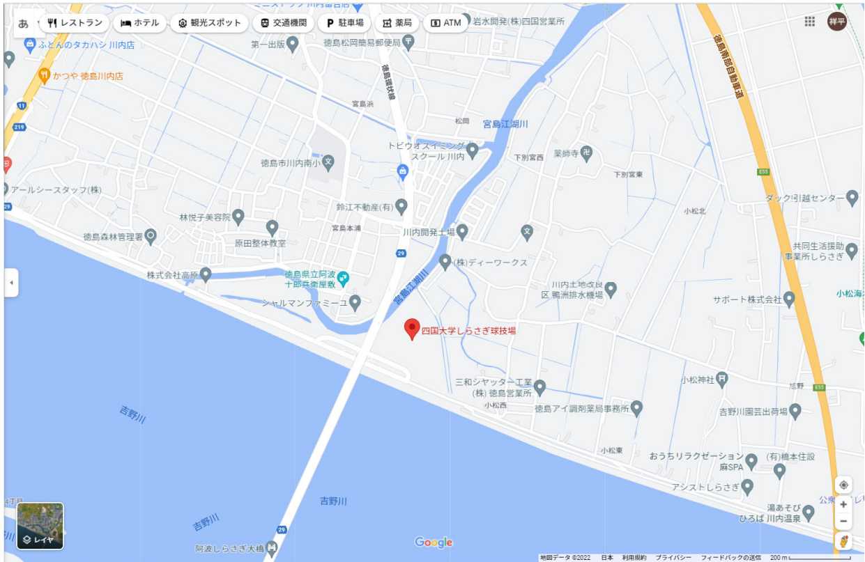
四国大学しらさぎ球技場 ( https://www.shikoku-u.ac.jp/institution/shirasagi/ )